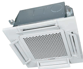
FDTC25VH1, FDTC35VH1, FDTC40VH, FDTC50VH, FDTC60VH