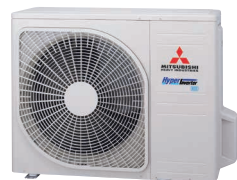
SRC40ZSX-W1 SRC50ZSX-W2 SRC60ZSX-W1